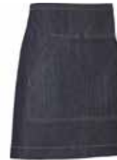
840 Dark Blue