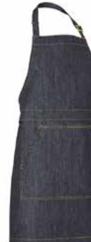
840 Dark Blue