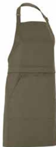
665 Dark Olive

Material: 100% ökologisch angebaute Baumwolle Fairtrade Gewicht: Twill 210 g/m 2 (665, 990), Denim 10,5 oz (840)