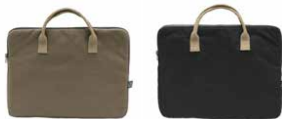
665 Dark Olive

Afmetningen: 50 cm, ø 26 cm, 25 l Material: 100% ökologisch angebaute Baumwolle Fairtrade Gewicht: 310 g/m 2