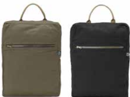
665 Dark Olive

Wir müssen immer Dinge mit uns nehmen. Zur Arbeit, von der Schule, die Zahnbürste, der Computer, Lebensmittel. Notwendigkeiten oder einfach Dinge, die man haben sollte. Cottover bietet eine kleine Kollektion der wichtigsten Träger, schlicht und erschwinglich, perfekt für grosse Drucke. Und wenn sie nicht gebrandet sind, sendet das Fairtrade-Label eine klare Botschaft.