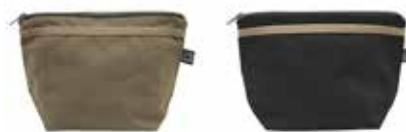
665 Dark Olive

Afmetningen: 28x12x38 cm, 13 l Material: 100% ökologisch angebaute Baumwolle Fairtrade Gewicht: 310 g/m 2