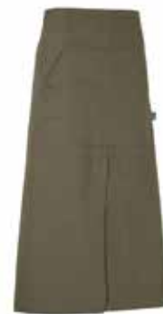
665 Dark Olive

Material: 100% ökologisch angebaute Baumwolle Fairtrade Gewicht: Twill 210 g/m 2 (665, 990), Denim 10,5 oz (840)