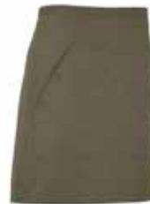
665 Dark Olive

Material: 100% ökologisch angebaute Baumwolle Fairtrade Gewicht: Twill 210 g/m 2 (665, 990), Denim 10,5 oz (840)