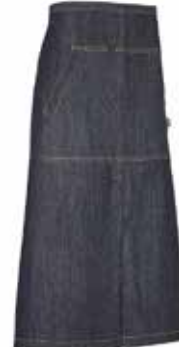
840 Dark Blue