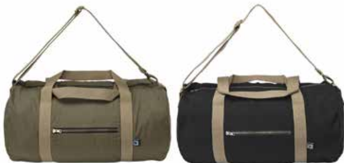
665 Dark Olive

Afmetningen: 16x10x17 cm Material: 100% ökologisch angebaute Baumwolle Fairtrade Gewicht: 310 g/m 2